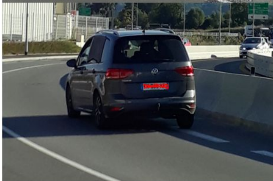
Direction Chambéry : Noter l'espace entre les véhicules et la glissière en béton armé