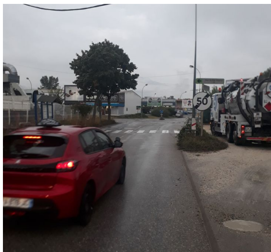
Vue direction Nord au bout de l'avenue des Landiers : Panneau B33 !

Cette portion se retrouve de fait autorisée à une circulation à 80 km/h depuis l'apparition en 2012 du panneau B33 (fin de limitation de vitesse à 50 km/h) au bout de l'avenue des Landiers, juste avant l'intersection avec la Rue du Pré Pagnon. Une limitation à 80 km/h est totalement inadaptée à cette zone, sujette à un trafic important et fréquentée par de nombreux cyclistes et des piétons en l'absence de trottoirs réglementaires. A cela s'ajoute une visibilité médiocre en raison de la présence l'autoport.