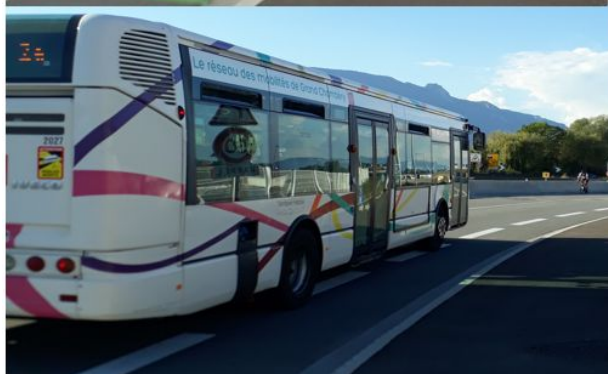
Direction Aix : Le cycliste bénéficie de l'espace dédié au trottoir en cas d'incident