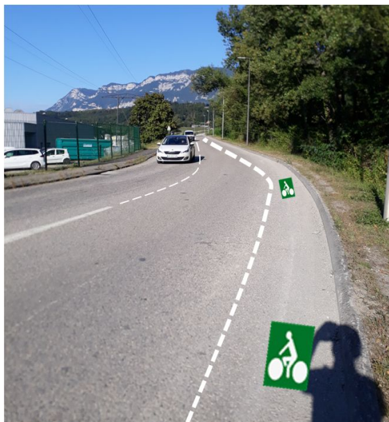
Rue des Epinettes : BC sens montant

Nous demandons la réalisation sans délai de bandes cyclables dans les deux sens montants ou sur l'intégralité du parcours en fonction des contraintes de voirie. Pour rappel, cet aménagement a été validé au compte-rendu du GTV du 26 mars dernier.