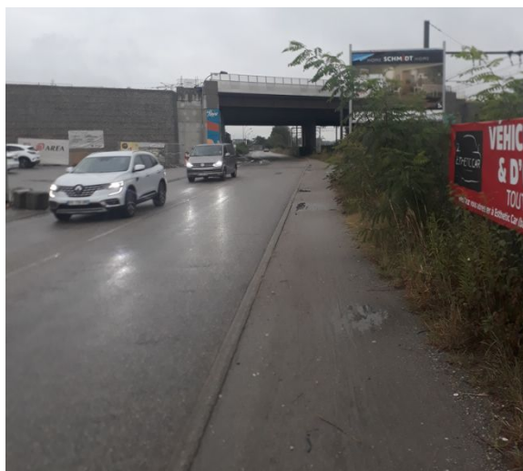
Vue direction Nord de la Rue Belle-Eau : vitesse limitée à 80 km/h !! Pas de trottoirs