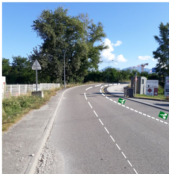
Rue du Borolan : BC sens montant

Pour finir, une reprise de peinture des aménagements cyclables ainsi qu'un élargissement de certaines bandes cyclables, particulièrement dans le sens Sud-Nord serait à envisager rapidement.